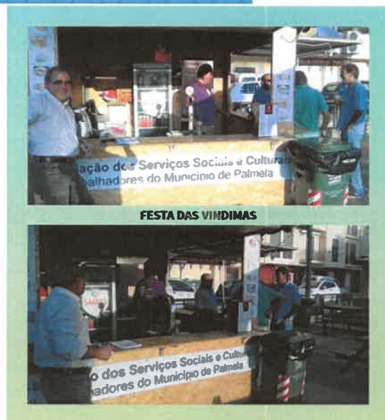
FESTA DAS VINDIMAS