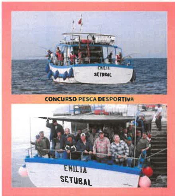
CONCURSO PESCA DESPORTIVA